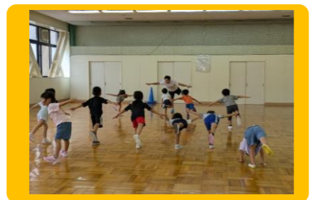
幼児運動能力向上教室