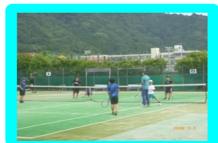
小学生硬式テニス