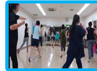
リズムホップクッキング