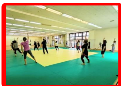
チャレンジフィットネス