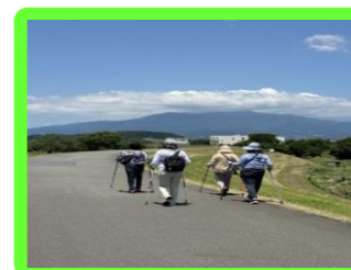
まちぶらルディック